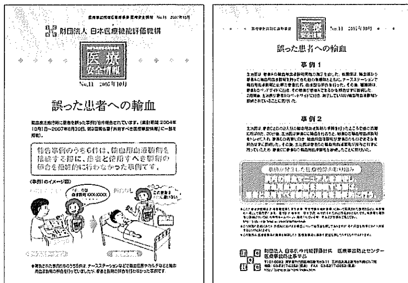
図表Ⅲ-3-14 医療安全情報No.11「誤った患者への輸血」