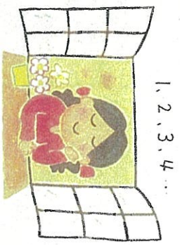
1, 2, 3, 4...

子どもが言うことを聞いてくれないときに、イライラすることは誰でもあること。でも、疲れていたりして、もともと抱えているストレス度が大きいと、子どものちよつとした行動（おもちゃの取り合い、すぐに動かないなど）をきっかけに、イライラが爆発してしまうことがあります。イライラが爆発する前に、クールダウンするための、自分なりの方法を見つけておきましょう。